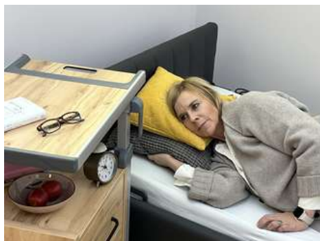
Mit dem innovativen Nachttisch Aparto brevo hat der Bewohner die vertrauten Gegenstände des Alltags jederzeit im Blick.

Wir haben eine Auswahl an Zubehör, das sich gut für diese Zwecke eignet. Es gibt ausklappbare Fallschutzmatten, die einfach vor dem Bett auf den Boden gelegt werden, oder ausrollbare Matten, die an der Längsseite des Bettes befestigt werden. Unser keilförmiges Fallschutzpolster wird so an das Bett herangeschoben, dass der Bewohner den Boden mit einer Abrollbewegung erreichen kann. All diese Produkte schützen vor Sturzverletzungen, ermöglichen eine freie Bewegung und unterstützen auch die Pflegekraft beim Knien oder Sitzen auf dem Boden. Zugleich sorgen sie für einen weichen, lückenlosen Übergang vom Bett oder Nachttisch zum Fußboden. Die Tiefposition des Tereno ist ohnehin so dicht über dem Boden, dass keine Gliedmaßen unter das Bett gelangen können.