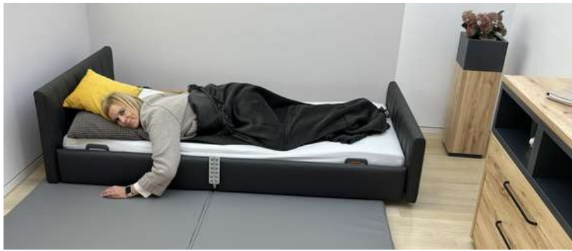
Sicher, elegant und individuell gestaltbar: Das Tereno ist ein würdevoller Ruhe- und Rückzugsort, in dem sich die Bewohner wohlfühlen.