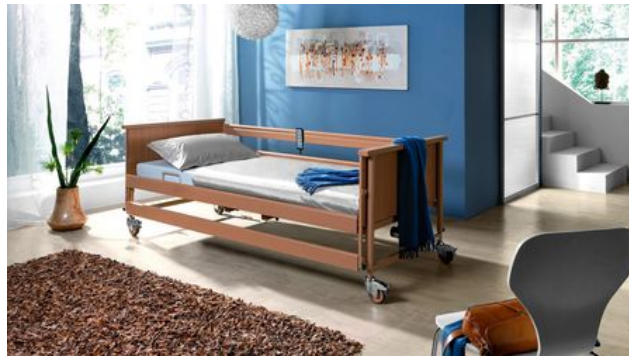
Produkte mit Herz und Verstand