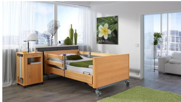
Produkte mit Herz und Verstand