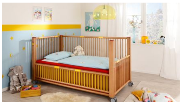
Produkte mit Herz und Verstand