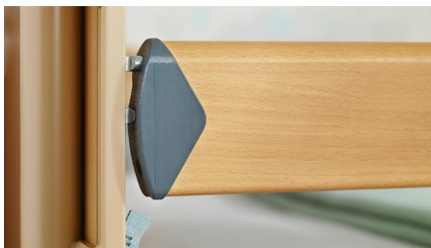
Jetzt aber DALI!

Wir haben einige Punkte verändert, um das Dali noch attraktiver zu machen. Zum Beispiel die Seitensicherungen: Die Holme werden demnächst anthrazitfarbene Abschlusskappen aus Kunststoff tragen. Das sieht gut aus und schützt die Holme vor Beschädigungen.