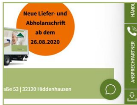
Der Chatbot macht durch eine Sprechblase unten rechts auf der Burmeier-Webseite auf sich aufmerksam.

den gewünschten Dokumenten der Burmeier-Webseite.