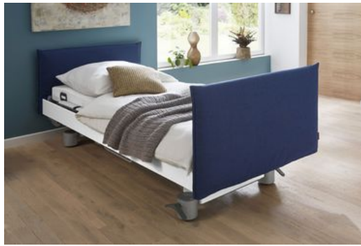
Modisch auf dem neuesten Stand: Das Pflegebett Venta mit nachtblauen Softcovern und weißen Seitenblenden.

Sie wünschen ein gepolstertes Pflege- oder Komfortbett von Stieglmeyer in einer dieser topaktuellen Farben? Dann schauen Sie bei unserem renommierten Partner Delius vorbei und schwelgen Sie in der großen Auswahl wohnlicher, pflegeleichter Stoffe. Die Serie Ambra Deligard bietet zum Beispiel vom satten Gelb 2550 bis zum Meeresblau 5552 nahezu alle modernen Töne.