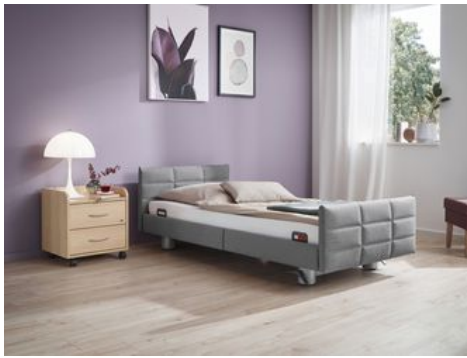
Gestepte Häupter für unsere Modelle Elvido und Libra schaffen eine wunderbar wohnliche Atmosphäre – hier das Kachel-Design in topaktueller Farbkulisse.

Damit stellt sich erneut die Frage nach den Farben: Welchen Ton sollte die Polsterung haben, um up-to-date zu sein? Was sind die Trendfarben des Jahres 2021? Die üblichen Kandidaten Grau, Braun und Beige oder doch lieber ein knalliges Grün?