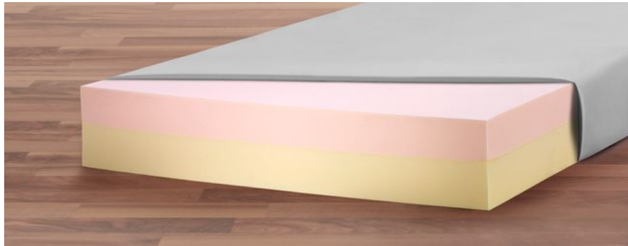
Die TEMPUR-MED® Premium-Matratze bietet mit ihrem viskoelastischen TEMPUR-Schaum einen besonders hohen Schutz vor Dekubitus

Diese gute Anpassung an die Liegefläche ist auch eine Stärke der neuen Soft-therm-Matratze. Hier sorgen feine Bohrungen in der Basisschicht für hohe Flexibilität. Die gesundheitsfördernde Wirkung etwa der Fowler- oder Cardiac-Chair-Position kann sich so ohne Abstriche entfalten. Zusätzlich leiten die Bohrungen Flüssigkeit ab und sorgen für eine gute Luftzirkulation.