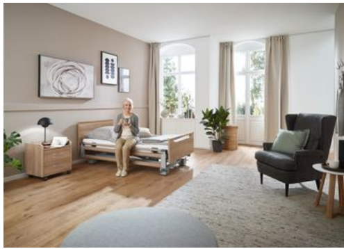
Das neue Regia mit Easy-Switch-System bietet mehr Flexibilität, Komfort und Design.