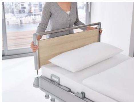
Die Häupter lassen sich sekundenschnell entriegeln und entnehmen, um einen besseren Zugang zum Patienten zu ermöglichen.

Bei modernen Krankenhausbetten wie dem Puro lassen sich Kopf- und Fußteile schnell entriegeln und abnehmen, um einen besseren Zugang zum Patienten zu erhalten. Wird diese Möglichkeit in Herford genutzt? „Wenn Menschen auf der Intensivstation einen zentralvenösen Katheter am Hals oder einen Beatmungsschlauch gelegt bekommen, nehmen wir die Kopfteile ab“, erklärt Frau Tesch. „Die Ärzte können dann ohne Behinderung arbeiten.“