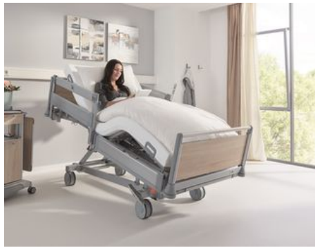
Pflegekräfte und Patienten können das Bett mit dem LCD-Handscher in eine bequeme Sesselposition bringen.