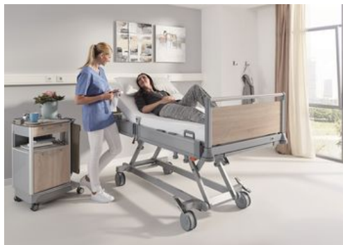
Wird das Puro für pflegerischer Tätigkeiten auf Hüfthöhe hochgefahren, stellt sich eine ergonomisch günstige aufrechte Körperhaltung von selbst ein.

Die elektrische Höhenverstellung der Betten spielt bei dieser Grundpflege eine wichtige Rolle. „Jede Pflegekraft fährt das Bett so hoch, dass sich die Matratze auf Hüfthöhe befindet“, sagt Frau Tesch. Die Höhenverstellung ist auf der Intensivstation die am häufigsten genutzte Verstellfunktion. Wird nicht am Bett gearbeitet, befindet es sich bei wachen Patienten zumeist in der tiefsten Position, um Sturzverletzungen vorzubeugen.