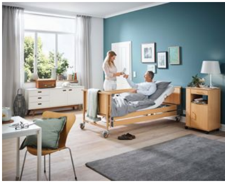
Durch den kabellosen Handschalter gewinnen Bewohner und Pflegende mehr Bewegungsfreiheit.