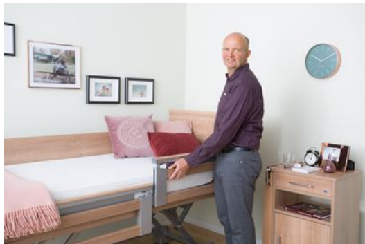
Wussten Sie schon ... ?

2. ... oder er wählt das untere Element mit einer wohnlichen Holzoptik.