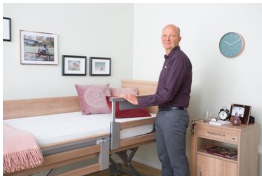
Wussten Sie schon ... ?

3. Für normgerechten maximalen Schutz zieht man beide Elemente hoch. Doch auch jetzt bleibt die Bewegungsfreiheit des Bewohners erhalten, wenn der fußseitige Teil der Seitensicherung nicht angestellt wird.