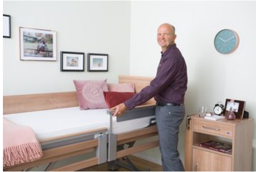
Wussten Sie schon ... ?