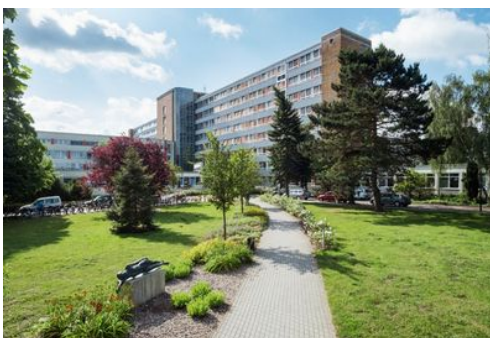
Klinikum Südost Rostock

Nach 27 Jahren in meiner Abteilung glaube ich manchmal, dass wir das Ziel erreicht haben – aber dann fällt mir immer wieder etwas Neues ein, das man optimieren könnte. Zum Beispiel haben wir alle elektrischen Betten mit einer neuen Halterung für den Handschalter nachrüsten lassen. Darin ist er viel besser vor Beschädigungen geschützt. Es ist wichtig, niemals an einer Stelle stehenzubleiben.