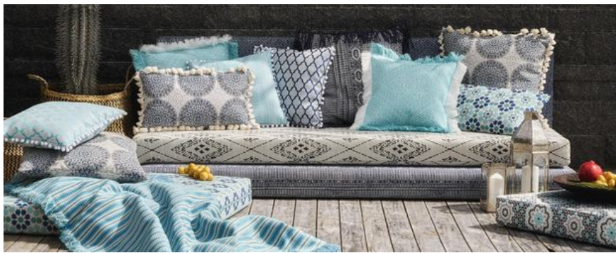
JAB Anstoetz begeistert seine Kunden mit kreativen Einrichtungsideen.

Die neue Auswahl für unser suite eMotion wirkt noch edler als zuvor, mit einem deutlichen Akzent auf einfarbigen Stoffen und sehr reduzierten floralen Mustern. Mit JAB Anstoetz und der Serie „Living“ von Stieglmeyer zieht eine neue Schlafkultur in den Alltag ein.