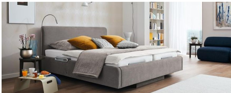
Unser Komfortbett suite eMotion profitiert von der Partnerschaft.

Attraktive Farben, edler Glanz, eine schmeichelnde Haptik – diese Vorzüge unseres Komfortbettes suite eMotion bleiben jedem Betrachter sofort im Gedächtnis. Dezente Grau-, Blau- oder Cremetöne und zuletzt ein neues elegantes Grau-Violett sorgen für Begeisterung bei den Kunden. Die neue Farbe gehört zur aktuellen Stoffkollektion für das suite eMotion von JAB Anstoetz.