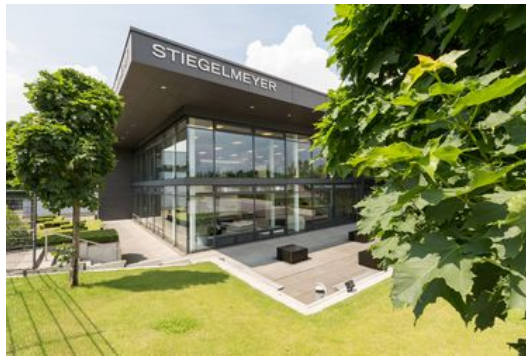
Das architektonisch attraktive Herforder Ausstellungsgebäude lädt zu einem Besuch ein.

Im Erdgeschoss wartet zunächst ein Ausflug in die erfolgreiche Stieglmeier-Geschichte. Leuchttafeln über historischen Betten aus dem gesamten 20. Jahrhundert erzählen von der Innovationskraft des Unternehmens. Einige Schritte weiter entfaltet das Komfortbett suite eMotion seinen ganzen Zauber vor edel gestalteten Wänden und Dekorationen.