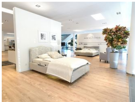
Das Komfortbett suite eMotion wird elegant präsentiert.

Das gemütliche Wohnheimbett Carino scheint ganz im Freien zu stehen: Die komplette Decke ist ein blauer Himmel mit strahlend grünen Baumkronen. Neben dem Pflegebett Soleo wartet ein Kaffeetisch mit Schwarzwälder Kirschtorte, in die man sofort hinein beißen würde, wenn sie nicht nur ein kunstvolles Requisit wäre.